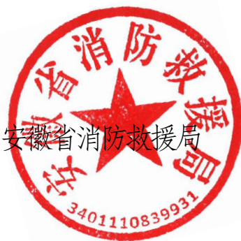
安徽省消防救援局