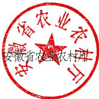
安徽省农业农村厅