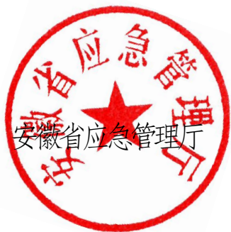
安徽省应急管理厅