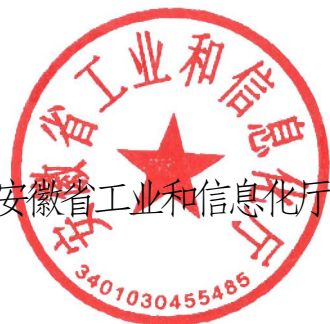
安徽省工业和信息化厅