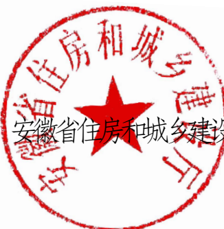
安徽省住房和城乡建设厅