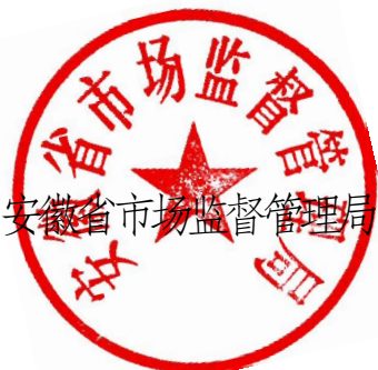
安徽省市场监督管理局