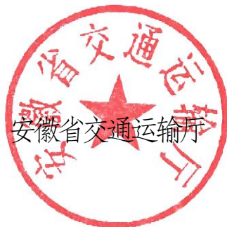
安徽省交通运输厅