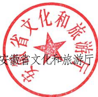
安徽省文化和旅游厅